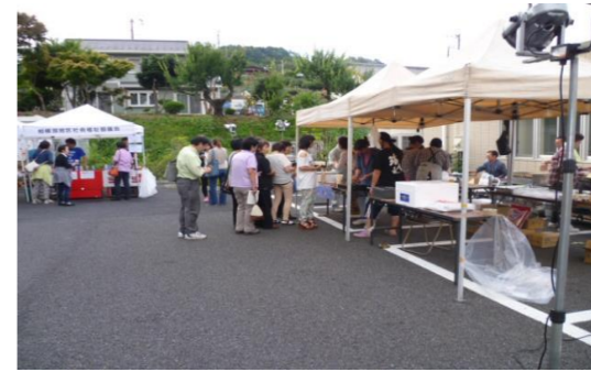
【ホタル狩りの前に腹ごしらえ】