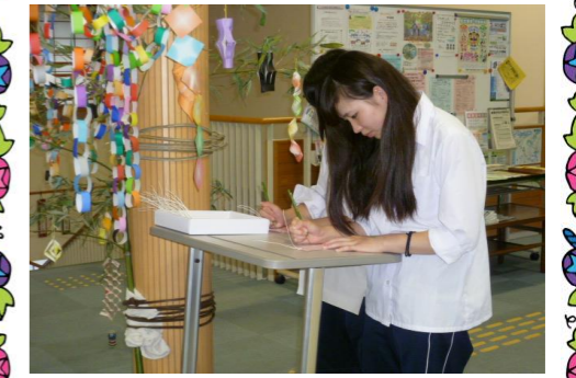
【短冊に願いを込めて書く中学生】