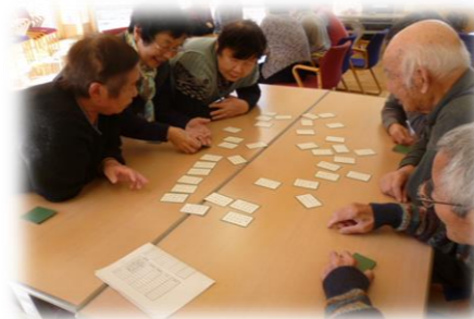
【必死の札取り合戦】