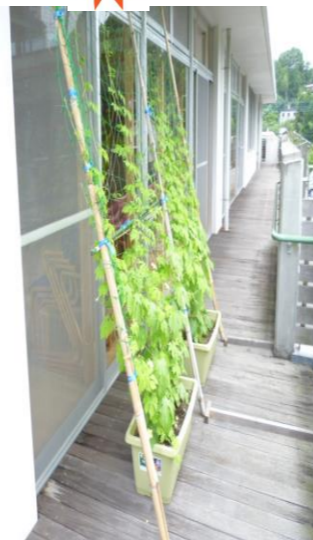
【リフレ緑のカーテン】